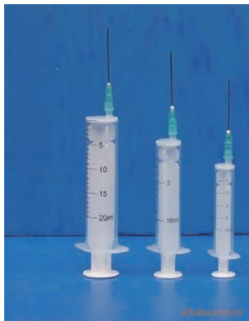
图 1-26 注射器和针头

(10) 酒精棉签。酒精棉签可以用于治疗局部的浅表擦伤,它对伤口可以起到消毒的作用,防止伤口发生感染,如图 1-27 所示。