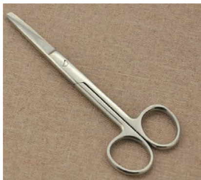
图 1-13 圆头剪刀