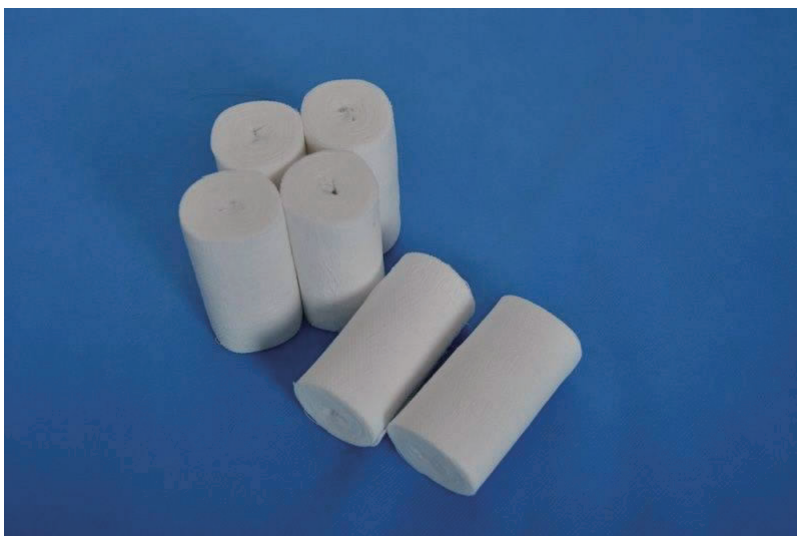
图 1-3 绷带

(1) 绷带。绷带(见图1-3)具有弹性,包扎伤口时不妨碍血液循环。2寸宽绷带适用于上肢,3寸宽绷带适用于下肢。