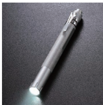
图 1-16 手电筒

(15) 酒精棉球。在对伤者、患者急救前,可用酒精棉球(见图 1-17)给伤者、患者的双手、伤口以及剪刀等工具消毒。