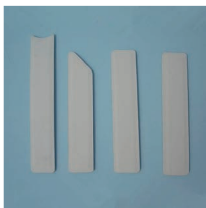
图 1-6 夹板