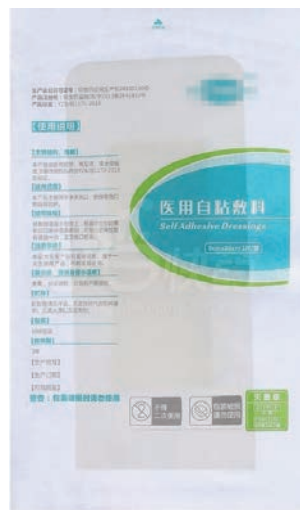
图 1-9 敷料

(8) 止血带。止血带(见图 1-10)可用于肢体出血、野外蛇虫咬伤出血时的应急止血。