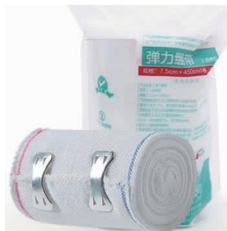
图 1-18 安全卡扣