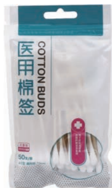
图 1-14 消毒棉签

(13) 0.9%生理盐水。0.9%生理盐水(见图 1-15)可用来清洗伤口。要尽量选择独立小包装或者中型瓶装,即使未用完也不可以放回急救箱中。