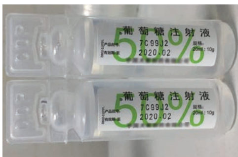
图 1-22 50%葡萄糖注射液

(6) 1:1 000 肾上腺素。1:1 000 肾上腺素具有使伤者、患者心肌收缩力加强、兴奋性增高、传导加速、心输出量增多等作用。但对全身各部分血管的作用不同,对皮肤、黏膜和内脏(如肾脏)的血管呈现收缩作用,对冠状动脉和骨骼肌血管呈现扩张作用,还可松弛支气管平滑肌及解除支气管平滑肌痉挛,可以缓解心跳微弱、血压下降、呼吸困难等症状。图 1-23 为盐酸肾上腺素注射液。