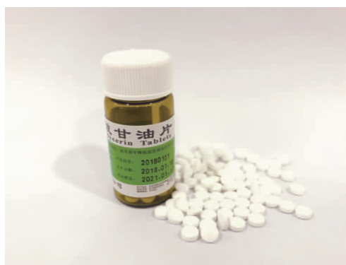
图 1-25 硝酸甘油片