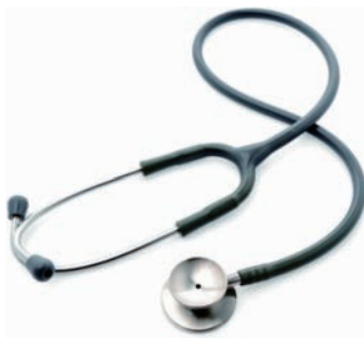
图 1-20 听诊器

(2) 听诊器。听诊器用于监听伤者、患者的心音、手腕脉搏等,如图 1-20 所示。