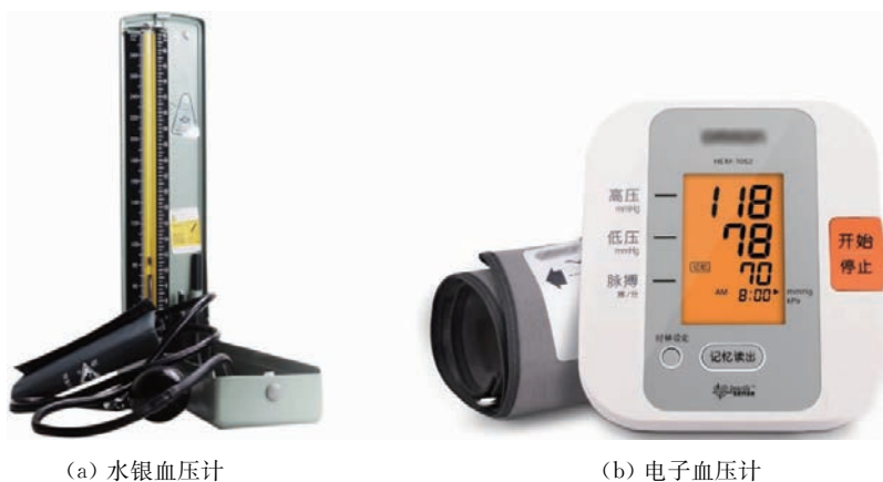
图 1-19 血压计

(2) 听诊器。听诊器用于监听伤者、患者的心音、手腕脉搏等,如图 1-20 所示。