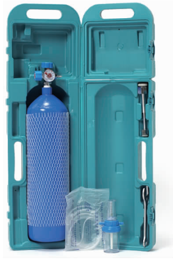
图 1-1 手提式氧气瓶