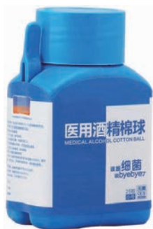
图 1-17 酒精棉球