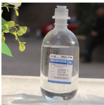
图 1-15 0.9%生理盐水