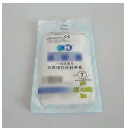
图 1-11 橡胶手套

(10) 外用烧烫伤膏。外用烧烫伤膏(见图 1-12)可用于伤者、患者烧烫伤处。