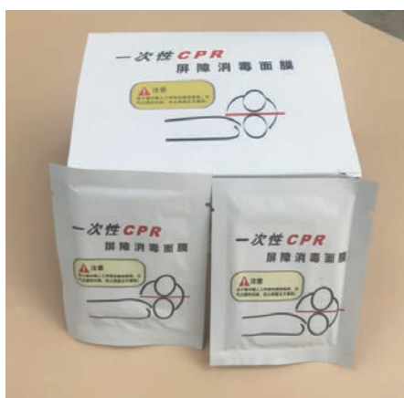
图 1-5 人工呼吸面膜

(3) 人工呼吸面膜。人工呼吸面膜(见图 1-5)由现场急救人员进行人工呼吸时使用,能防止急救人员感染。