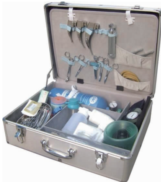
图 1-2 急救箱