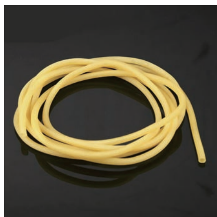
图 1-10 止血带

(9) 橡胶手套或防渗透手套。橡胶手套(见图 1-11)或防渗透手套能防止急救人员被感染。