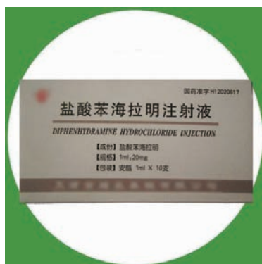
图 1-24 盐酸苯海拉明注射液

(8) 硝酸甘油片。硝酸甘油片(见图 1-25)通常用于冠心病、心绞痛的治疗及预防,也可以用于降低血压或者治疗充血性心力衰竭。