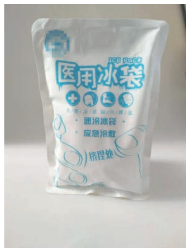
图 1-8 医用冰袋

(7) 敷料。敷料(见图 1-9)可以抵御机械因素(如碰撞等)、污染、化学对伤处造成的刺激,防止再度感染、电解质或者热量丢失,对伤口进行全面保护。