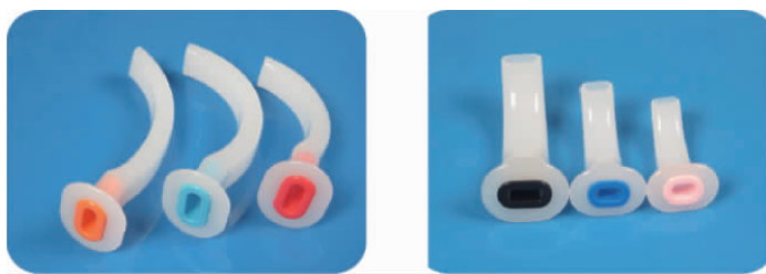
图 1-21 口咽气道

(3) 口咽气道。口咽气道(见图 1-21)用于现场急救和心肺复苏时,防止伤者、患者舌后坠,维持伤者、患者的气道开放。