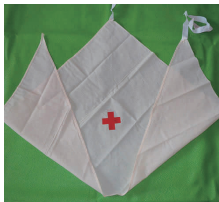
图 1-7 三角巾