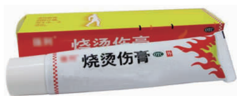
图 1-12 外用烧烫伤膏

(10) 外用烧烫伤膏。外用烧烫伤膏(见图 1-12)可用于伤者、患者烧烫伤处。