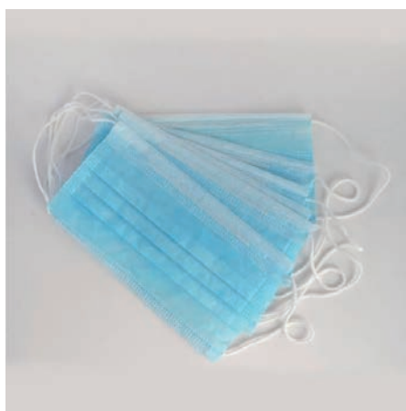
图 1-28 医用口罩

(11) 医用口罩。医用口罩可以过滤空气中的微粒,阻隔飞沫、血液、体液、分泌物等,如图 1-28 所示。