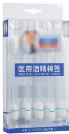
图 1-27 酒精棉签

(11) 医用口罩。医用口罩可以过滤空气中的微粒,阻隔飞沫、血液、体液、分泌物等,如图 1-28 所示。